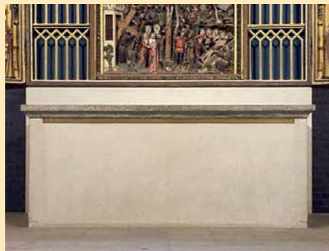
Der Hauptaltar am Karfreitag 2022