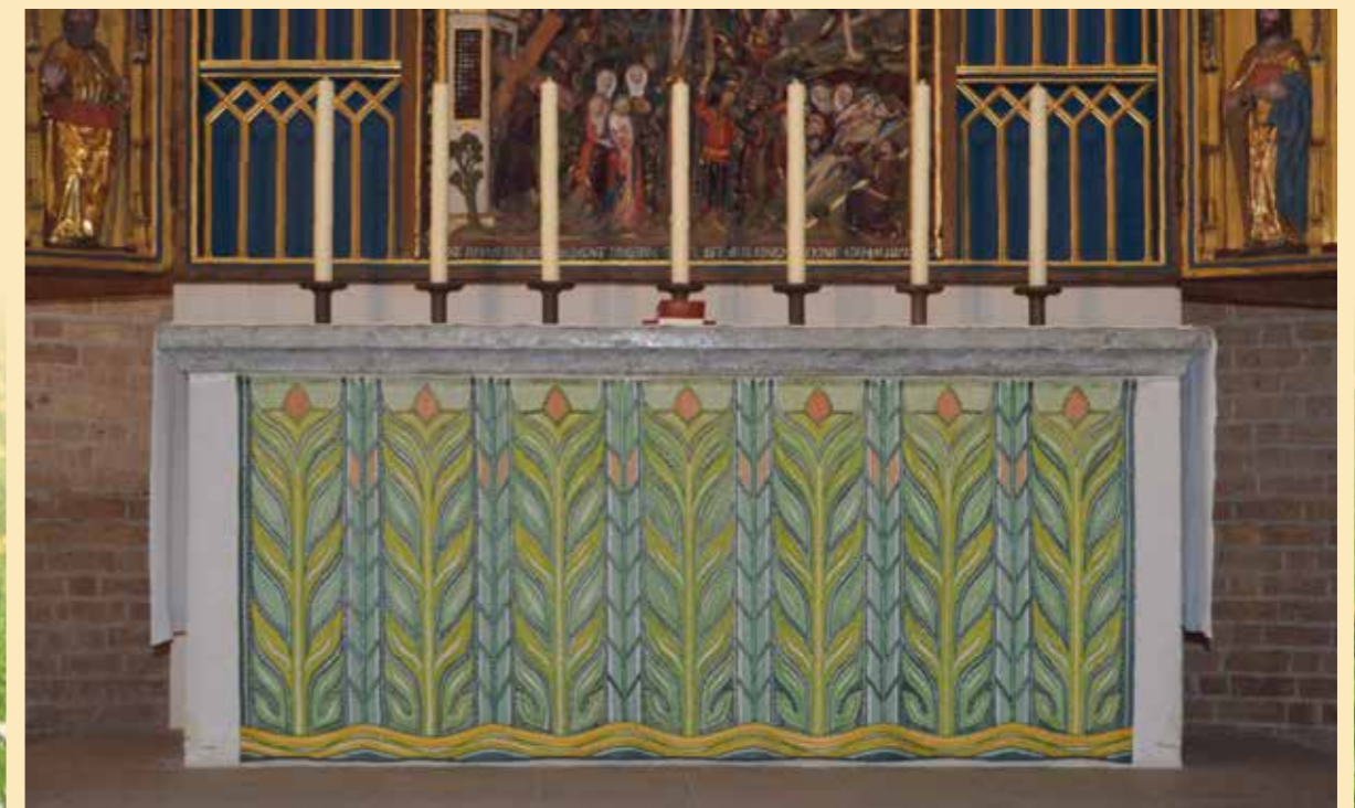
Das wunderschöne grüne Parament am Hauptaltar im Ratzeburger Dom