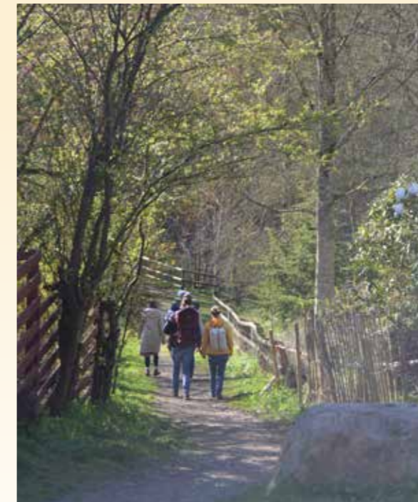
Wege-Gottesdienst im Kupfermühlental – gut 30 Menschen machten sich auf den Weg.