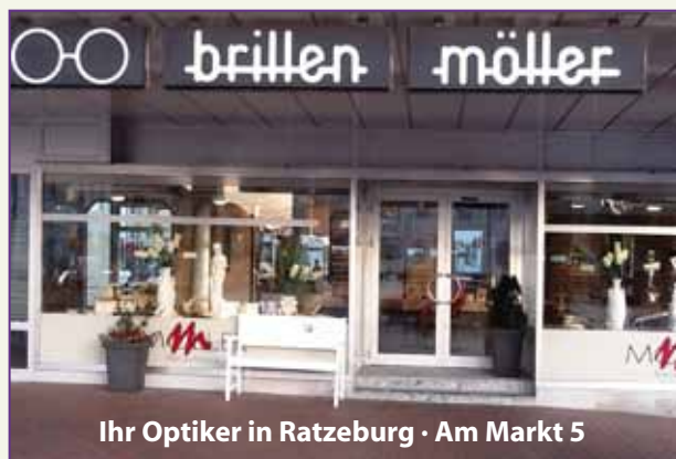
Ihr Optiker in Ratzeburg · Am Markt 5